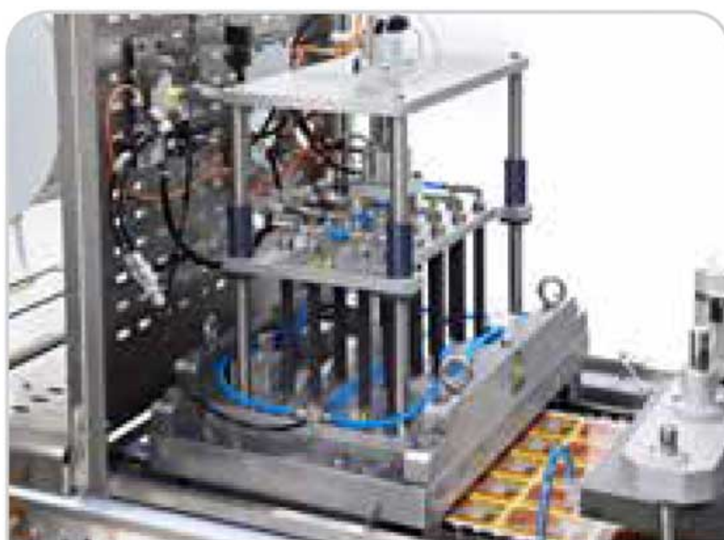
Cortes con forma