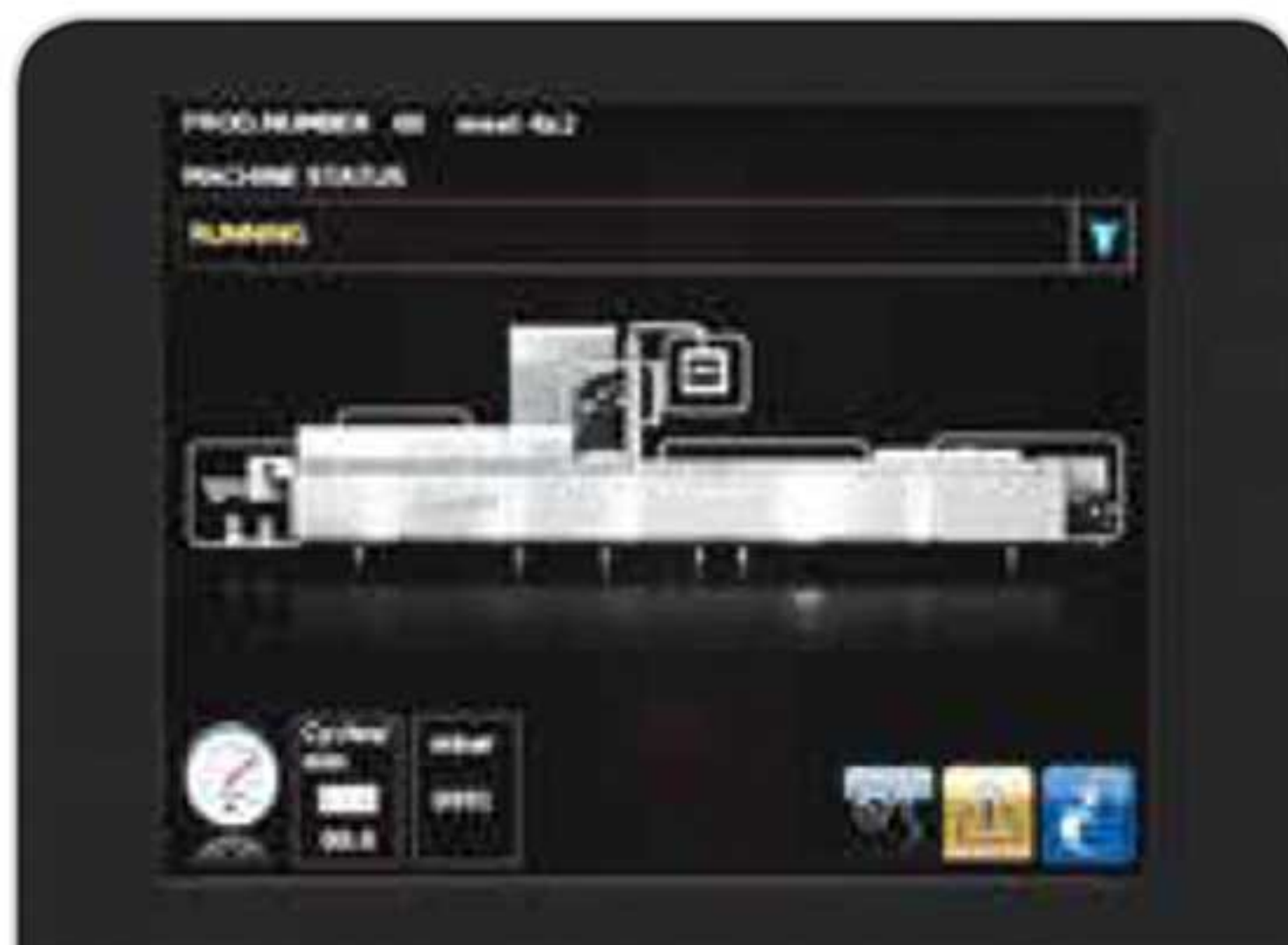
Interfaz intuitivo por pantalla táctil