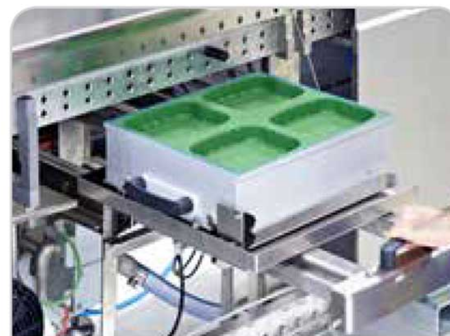
Cambio fácil de formato