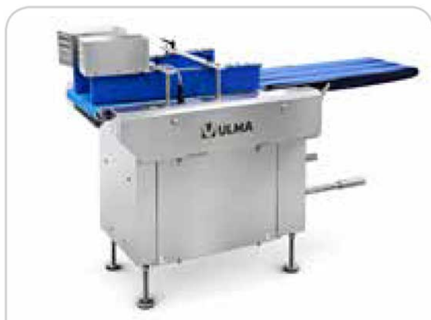
Alineador de bandejas